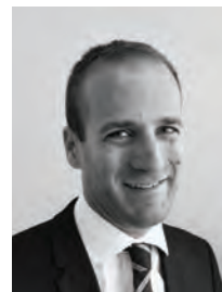
Par Bruno Delhoustal, diplômé d'expertise comptable 1

Le sujet du mémoire doit être proposé à l'agrément du jury national, six mois au moins avant la date de début des épreuves de la session au cours de laquelle le candidat souhaite soutenir. Rappels sur cette procédure et focus sur le rôle du SIEC.